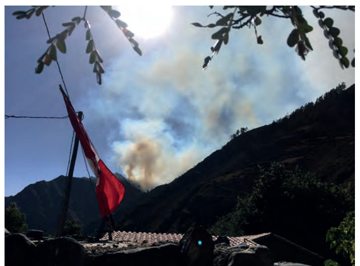
Skogsbranden bakom huset pågår i flera dagar