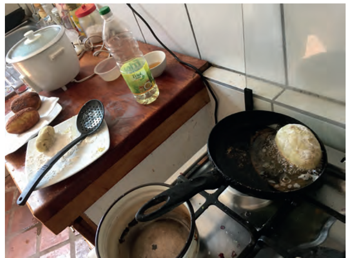
Pepe lagar peruansk husmanskost.