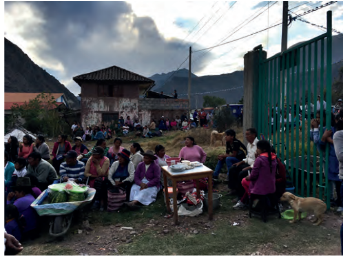
Fest i byn, Arín.