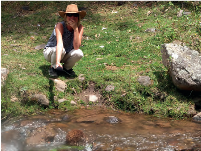
Ljudupptagning vid bergets fot