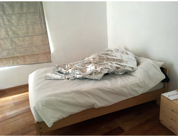
Det är själen som drömmer, inte individen.