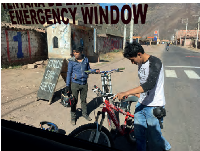
Bussen, raksträckan genom Urubambadalen