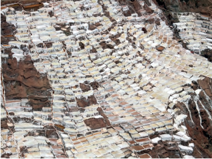
Salinas de Maras-Valle Sagrado- Cuzco..