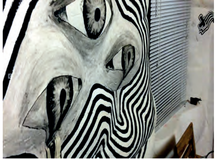
Nelsons ljudstudio, KAI