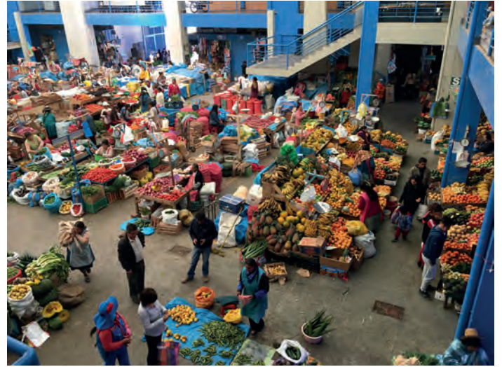
Marknaden i Urubamba